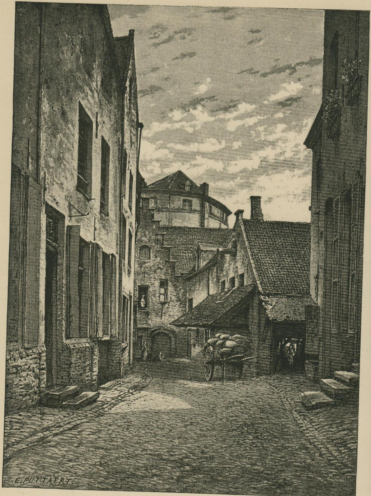
LE BORGVAL. Dessin original de E. Puttaert.